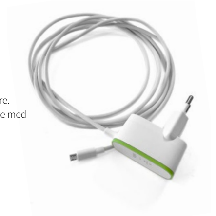
Mobile Power Laddare. En Micro USB-laddare med kraftfull prestanda.