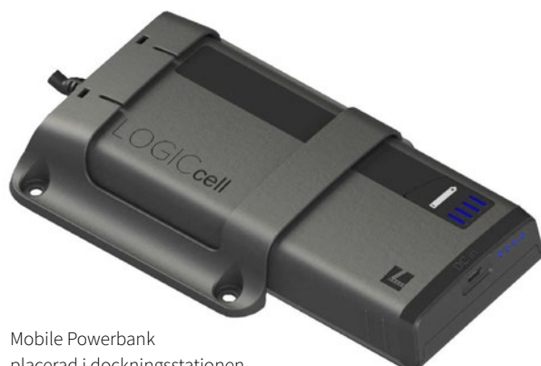
Mobile Powerbank placerad i dockningsstationen.